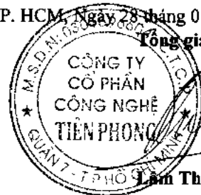
Lâm Thiều Quân